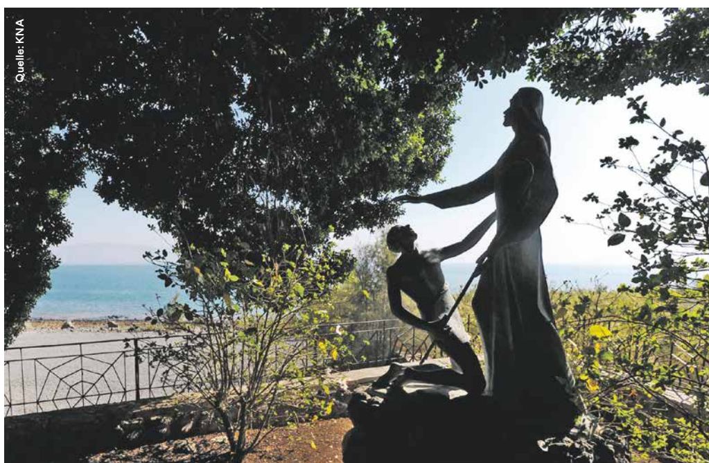
Eine Statuengruppe am Nordufer des See Genezareth in Galiläa stellt die Berufung des Petrus zum Hirten der Kirche dar. Hier soll Jesus nach seiner Auferstehung seinen Jüngern erschienen sein.