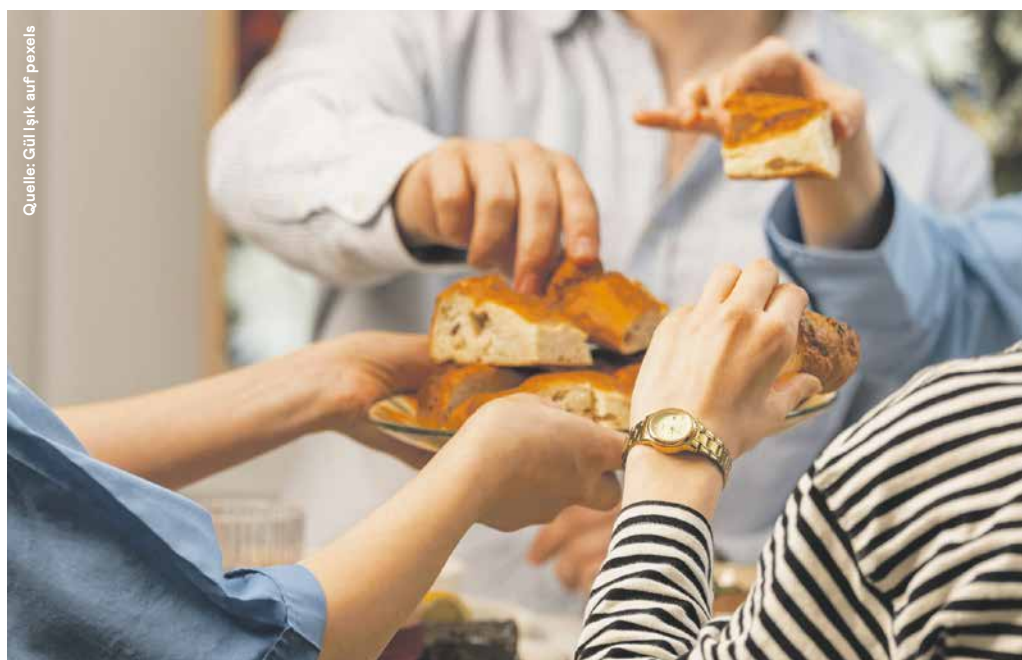
Beim Brechen und Teilen des Brotes haben die Jünger im fremden Mann den auferstandenen Jesus erkannt. So lesen wir es im Neuen Testament.

Die ersten Christinnen und Christen begannen in Jesus den «Christos», den Gesalbten, auf Hebräisch «Maschiach», aus dem das Wort «Messias» wurde, zu sehen. Der Glaube daran, dass Jesus auferstanden ist, führte dazu, dass sie die Ankündigungen des Messias in der Hei-