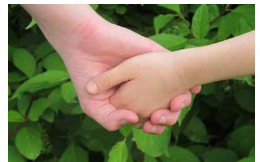
Leitgedanke: Hand in Hand mit Jesus

Wir wünschen den Erstkommunionkindern und Ihren Familien ein schönes Fest, alles Gute und Gottes Segen.