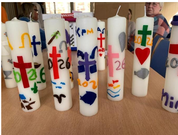
Osterkerzen der Kommunionkinder