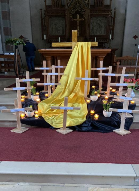
Dekoration in der St. Stephanuskirche : Mit ihr wird an die Orte des Krieges und der Gewalt auf der Erde erinnert und die österliche Hoffnung zum Ausdruck gebracht