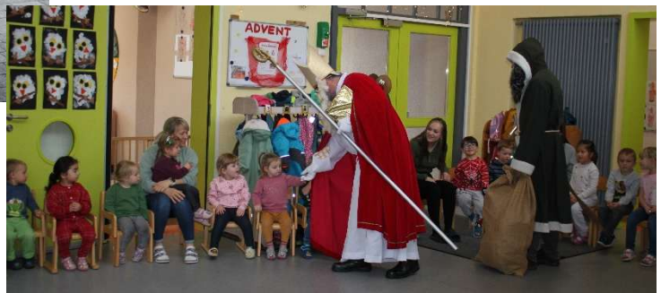
St. Nikolaus und Ruprecht haben jedes Kind einzeln begrüßt

Tags drauf, am Freitag, den 5.12. kam Sankt Nikolaus mit seinem Gehilfen Knecht Ruprecht zu uns und freute sich, dass die Kinder so fleißig für ihn geübt haben. Es gab viel Lob und nur wenig Tadel.