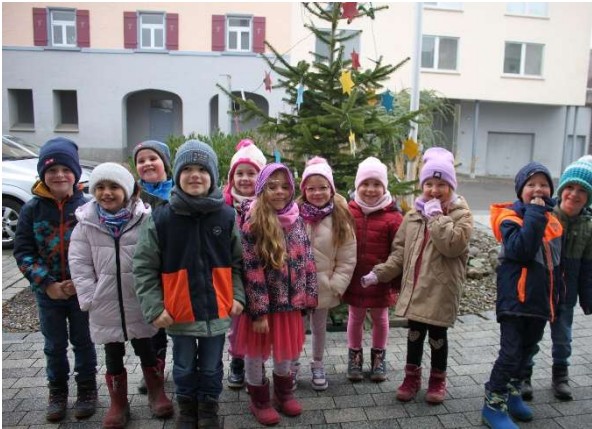
So schön wurde der Christbaum bei der Volksbank

Ein festes Ritual bei uns ist, den Christbaum bei der Volksbank zu schmücken. Das übernahmen die Vorschüler am Donnerstag.