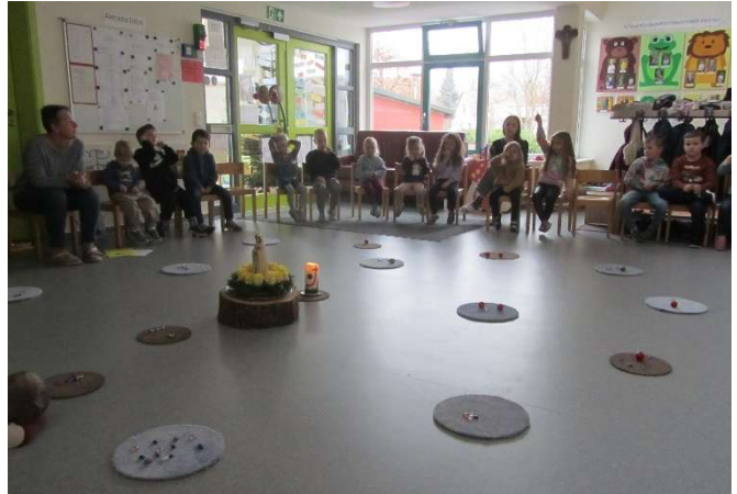
Die Marienstatue wurde schön geschmückt

Am Dienstag, den 2. Dezember machte die Marienstatue auf ihrer Herbergssuche bei uns im Kindergarten halt. So konnten alle Kinder diese schöne Statue in Ruhe betrachten. Danach überlegten die Kinder, wofür sie ihrer eigenen Mama alles „Danke“ sagen wollen.