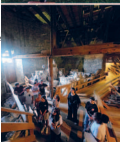
Oberes Bild: Abschluss 1. Sek und unteres Bild: auf dem Estrich oberhalb des Schiffs der Klosterkirche in St. Gallen

über das Erlebte aus. Dabei wurde deutlich, dass die Jugendlichen das Gefühl mit nach Hause nahmen, dass hinter einem solchen Bauwerk mehr steckt als nur menschliches Können und Handwerk. Viele waren beeindruckt davon, wie viel Glaube, Hingabe und Vertrauen in Gott es brauchte, um einen solchen Ort zu schaffen und über Generationen hinweg zu erhalten.