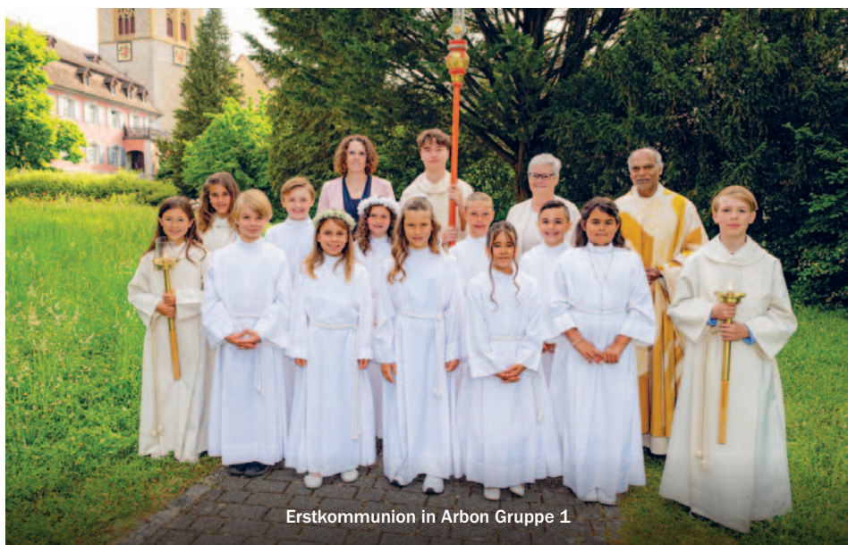
Erstkommunion in Arbon Gruppe 1