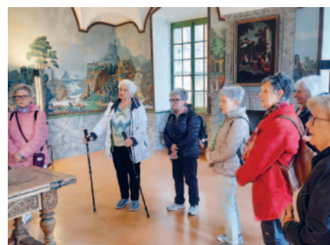
Aufmerksame Zuhörerinnen im Stockalperpalast in Brig

Wo muss man in einer Woche Wallis unbedingt hin – nach Zermatt! Gleich beim Gang durch die Hauptstrasse fiel uns auf, wie viel auch heute noch gebaut wird. Der anschliessende AHV-Weg erwies sich dann für eine Gruppe als ziemlich abenteuerlich, zum Glück kamen alle heil zurück. Und bei zunehmend schönem Wetter zeigte sich