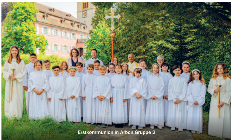
Erstkommunion in Arbon Gruppe 2

Nach dem gemeinsamen Erinnerungsfoto mit Priester Joseph Devasia und den Ministrantinnen und Ministranten zogen die Erstkommunionkinder feierlich in die festlich geschmückten Kirchen von Arbon und Roggwil ein.