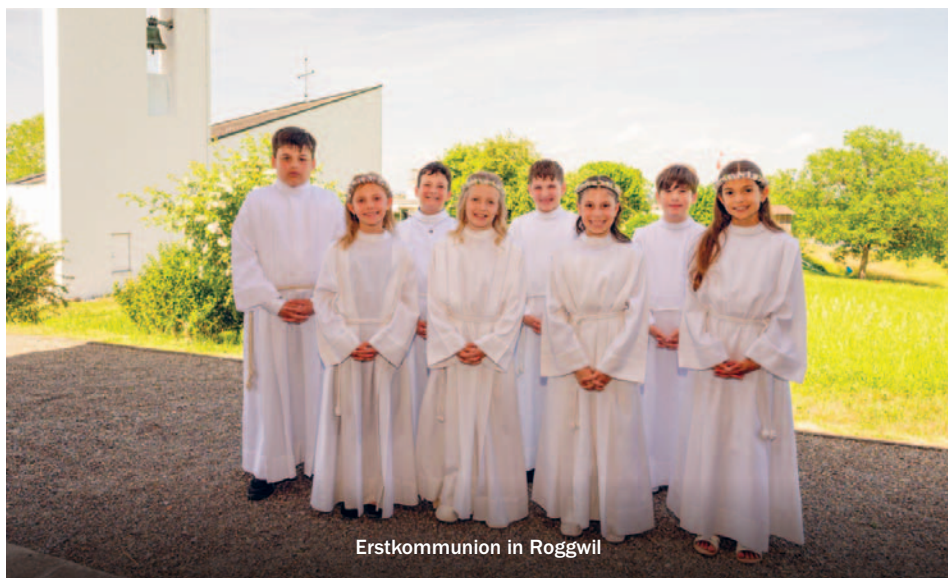
Erstkommunion in Roggwil

Nach beinahe einem Jahr der Vorbereitung durften 37 Kinder unserer Pfarrei ihre Erstkommunion feiern. In drei festlichen Gottesdiensten versammelten sich die Mädchen und Jungen im Pfarreizentrum Arbon beziehungsweise im Pavillon Roggwil, wo die Feier jeweils mit einer kleinen Begrüssungszeremonie begann.