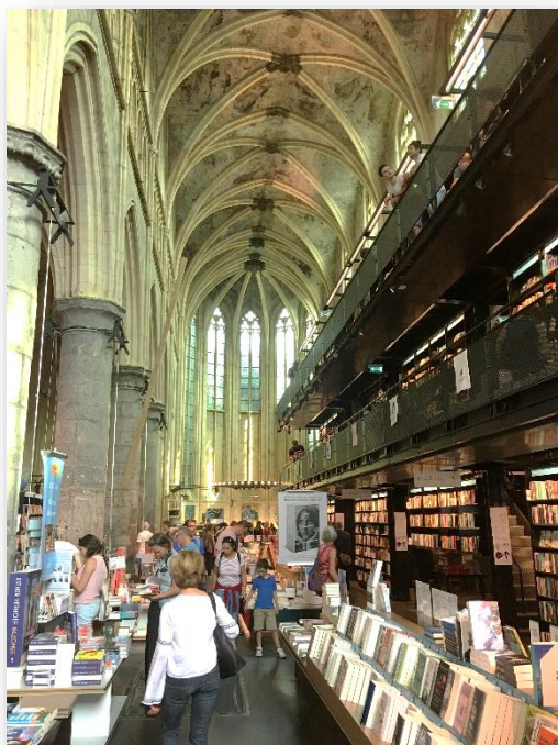
Dominikanerkirche in Maastricht