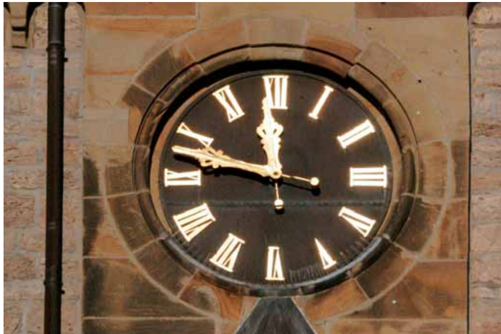
Turmuhr von St. Severin