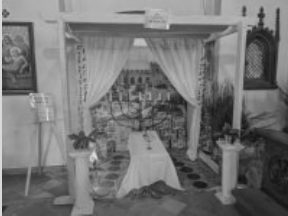
Feier vom letzten Abendmahl