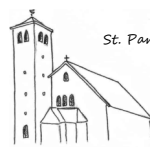
St. Sebastian, Salwey