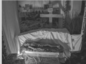
Jesus im heiligen Grab