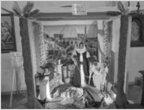
Einzug Jesu in Jerusalem