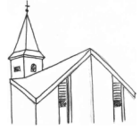
St. Cäcilia, Wenholthausen