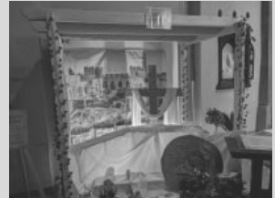
Das Grab ist leer