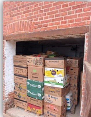
Das Lager, gefüllt bis an den Rand