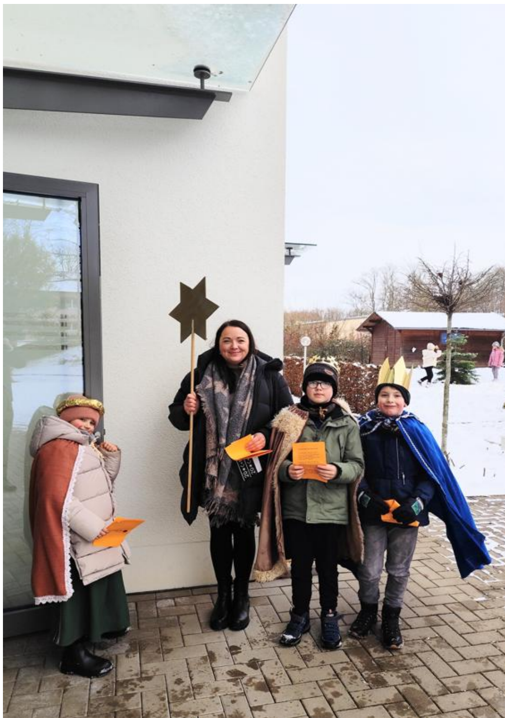
Sternsinger/innen am Pfarrbüro Espelkamp

Taufe des Herrn – 2.-5. Sonntag im Jahreskreis