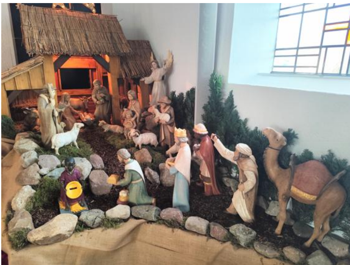
Neue Krippenfigur in St. Michael Rahden