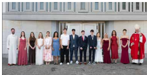
20. Juni 2026