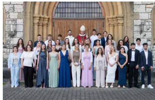
21. Juni 2026