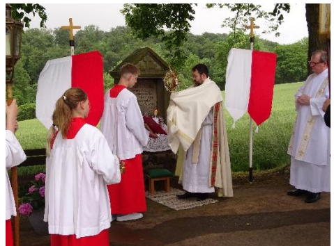
Fotos der Prozession in Heddinghausen