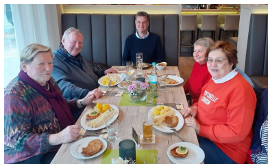
Spargelessen als Stärkung vor der Frauenkundgebung und dem Musical in Ahmsen