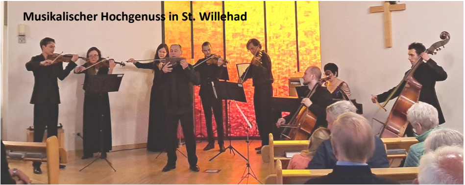
Musikalischer Hochgenuss in St. Willehad

Meisterhafte Klänge waren es, die Anfang Mai unsere Kirche erfüllten: Das Klassik-Ensemble „The Chambers“ war zu Gast und begeisterte vor vollem Haus. Ob es Ravel's Boléro war, der sich nicht zuletzt dank eines beeindruckenden Trommelsolos bis zur Ekstase steigerte, oder Auszüge aus Verdis La Traviata, in denen der Panflötist brillieren konnte – „die Virtuosen aus Köln“ verstanden etwas von ihrem Handwerk und berührten die Herzen ihres Publikums.