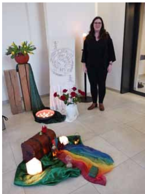
Märchenabend 2025