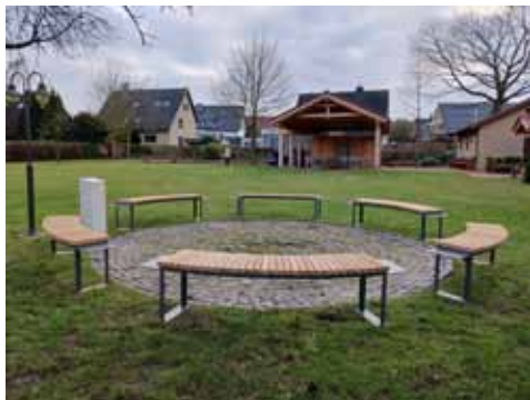
Sechs neue Bänke mit Pavillon und Boule Bahn im Hintergrund.

Finanziert wurden sie, wie auch das gesamte Ensemble auf der Pfarrwiese, nicht aus dem Etat der Kirchengemeinde, sondern durch Förder- und Sponsoringelder, sowie durch ganz viel Ehrenamtsstunden.