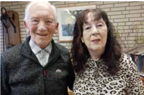
Autorin: Erika Heyde. Musik: Heinz Oberwestberg.

„Von kleinen und großen Leuten“ handelten nicht nur die selbstgeschriebenen Geschichten und Erzählungen aus ihrem fünften veröffentlichten gleichnamigen Buch, sondern auch die ausgewählten Musikstücke.