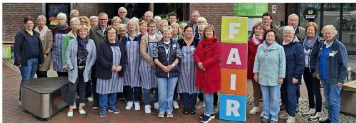
Ehrenamtliche Helferinnen des jährlichen Kartoffelfestes 2025

Bitte merkt euch den Termin schon jetzt vor – wir freuen uns darauf, diesen besonderen Tag mit euch zu feiern!