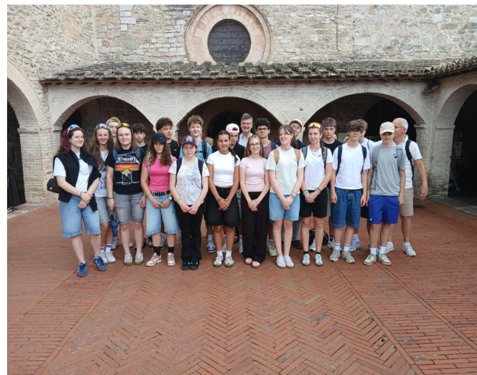
Firmlinge unserer drei Pfarreien auf ihrer Wallfahrt nach Assisi