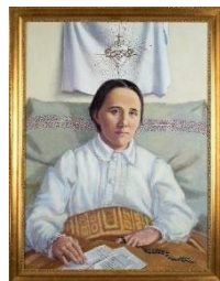
Hl. Anna Schäffer,

Anlässlich des Jubiläums wird die Reliquie der hl. Anna Schäffer vom 15.8. bis 17.8.25 in der Expositur Peter und Paul in Bubach am Forst zu verehren sein.