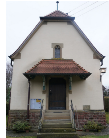
Die Herz-Jesu-Kapelle in Dilsbergerhof - hier treibt der Schädling sein Unwesen

reits einige Aktionen durchgeführt, um Spenden zu sammeln. Wer ebenfalls einen Beitrag zu einer „holzwurmfreien“ Herz-Jesu-Kapelle Dilsbergerhof leisten möchte, kann sich jederzeit an eines unseres Pfarrbüros wenden. Wir freuen uns über Ihren Beitrag und bedanken uns herzlich für die Unterstützung.