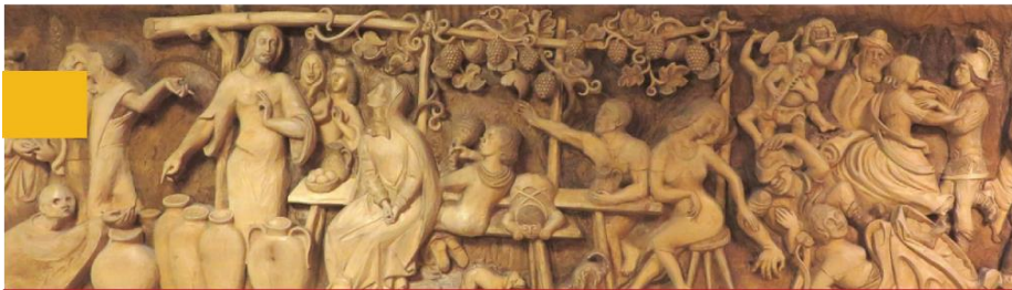
Wandrelief Pfarrsaal Wöschbach von B. Rumhold