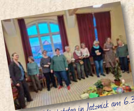
Beim Weltgebetstag in Jatznick am 6.3. und in Dargitz am 15.3. tanzten wir zu afrikanischen Rhythmen.