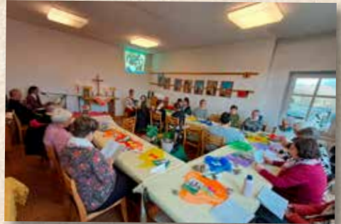
Unser kleiner Gemeinderaum in Dargitz war an diesem Sonntagnachmittag gut gefüllt.