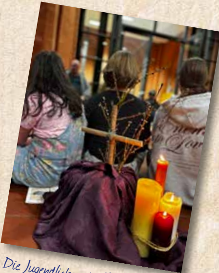
Die Jugendlichen der Theatergruppe haben in der Passionszeit eine Andacht zum Thema Ausgrenzung gestaltet.

Die Kirchengemeinde beteiligte sich am Pasewalker Stadtringfest mit verschiedenen Angeboten. Die Jugendlichen aus Jugend- und Theatergruppe hatten eine Fotowand gestaltet und betreut. Besucher konnten ein kniffliges Wiesen- und Gartenkräuterquiz lösen sowie leckere Produkte aus fairem Handel am FAIRSTAND verkosten.