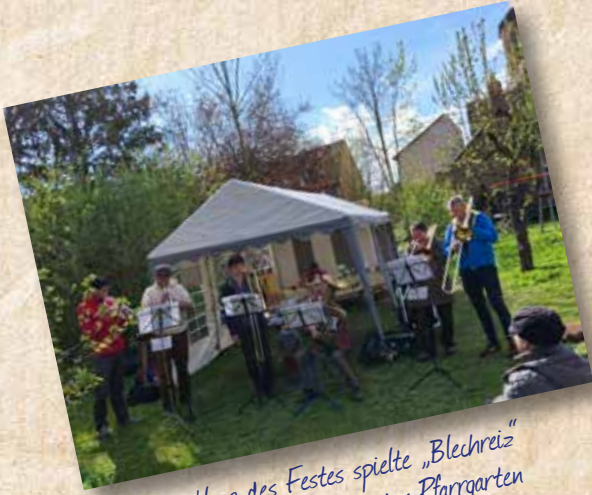
Zum Ausklang des Festes spielte „Blechreiz“ ein schwungvolles Programm im Pfarrgarten