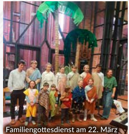
Familiengottesdienst am 22. März

Alle weiteren Konzerte vom Deutsch-Polnischen Kultursommer finden Sie im gelben Veranstaltungsheft 2026.