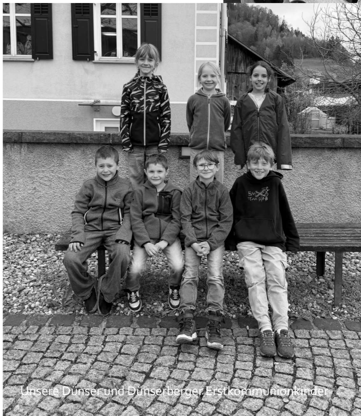
Unsere Dünser und Dünserberger Erstkommunionkinder