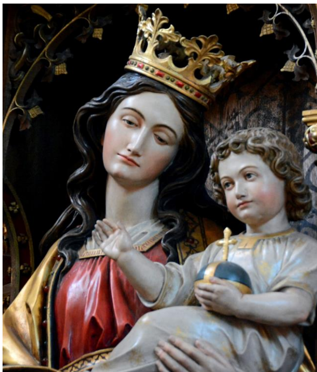
Mutter Gottes St. Anna Kapelle

Burrweiler, Edenkoben, Edesheim, Flemlingen mit Böchingen, Gleisweiler mit Frankweiler, Hainfeld mit Rhodt, Roschbach mit Walsheim, Sankt Martin und Weyher