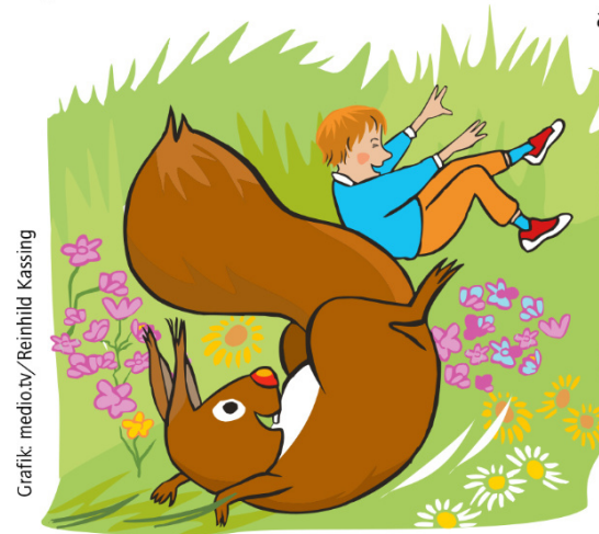
Grafik: mediotv./Reinhold Kassing

Und genau das habe ich ihr dann auch erzählt. Erst hat Pauline mich ganz traurig angesehen und dann aber hat sie aus vollem Hals gelacht. „Ach, Maxi! Ja, wenn die Kinder groß sind, ziehen sie aus, weil sie dann zum Beispiel eine Arbeit in einer anderen Stadt haben. Aber wenn man erwachsen ist, heißt das nicht, dass man keinen Spaß mehr haben darf.“ „Echt nicht? Heißt das, dass ich auch als erwachsenes Eichhörnchen noch Purzelbäume machen darf?“ „Na klar darfst du das! Und du darfst albern sein. Und wir Zwei sind dann immer noch Freunde. Ok?“