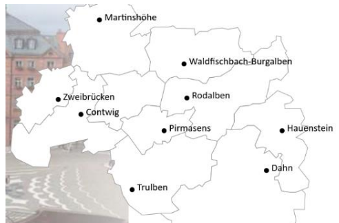
Das jetzige Dekanat Pirmasens – die neue Pfarrei „Pirmasens“