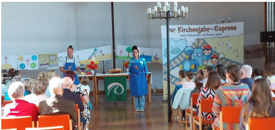
Schulanfangsgottesdienst am 14.9.2025 im Gemeindezentrum