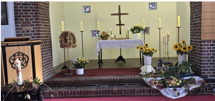
Andacht zum Erntedank in Finkenheerd

Wir danken Gott, dass er uns so reich versorgt, dass wir etwas abgeben können.