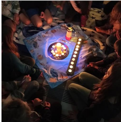
Andacht mit Kindern in der Kirchennacht