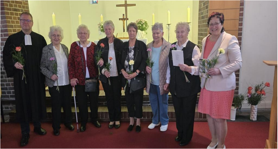
Jubelkonfirmation in Finkenheerd