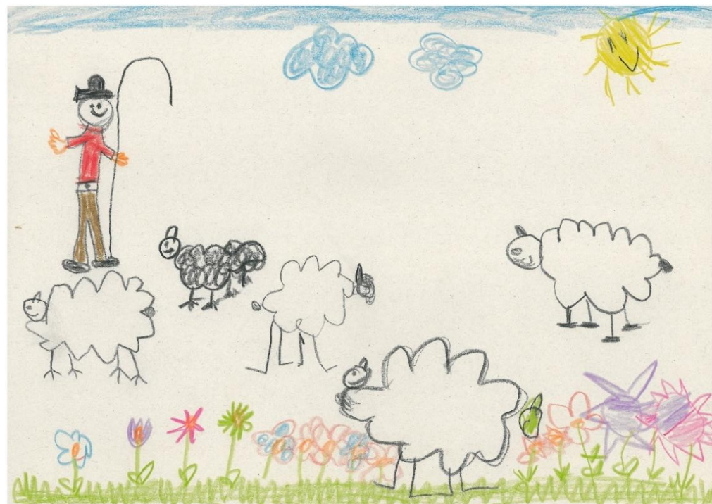
Das Bild hat ein Kind aus unserem Kindergarten gemalt.

Ein jeder Mensch macht Gott Freude, wenn er sich vom Guten Hirten suchen und finden lässt.