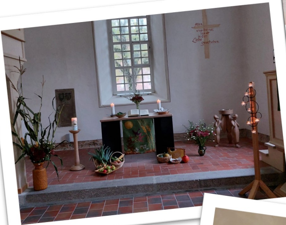
Der geschmückte Altar in der Kirche in Nausis.