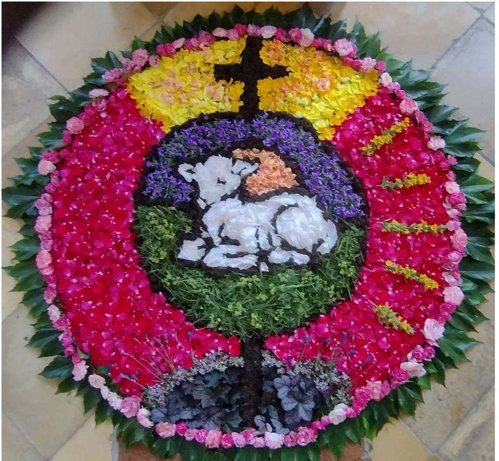
Blumentepich der Pfarrei Mariae Himmelfahrt Walkersaich im Jahre 2025