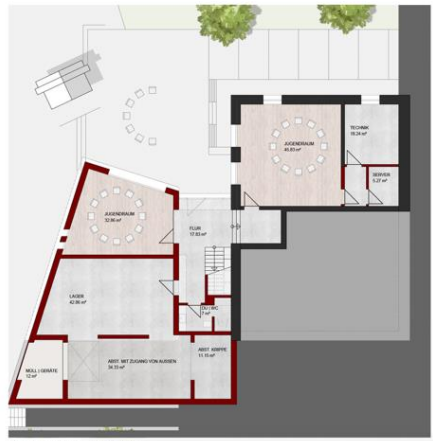
GRUNDRISS UNTERGESCHOSS | M. 1 : 100

Unterschoß mit Jugendbereich & Lagerflächen