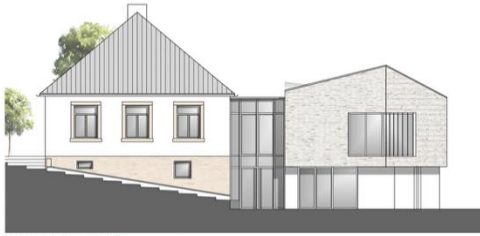
ANSICHT VON NORDEN | M. 1 : 100

Nordansicht: Die Fuge ist deutlich zu erkennen und auch die große Fensterfront des geplanten Anbaus.