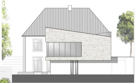
VON WESTEN | M. 1 : 100

Westansicht: Der Saal im oberen Bereich springt ein wenig vor. Das gegenläufige Pultdach setzt architektonische Akzente.