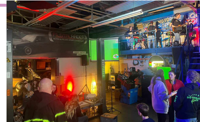
secret places in der Werkstatt von Filstraläder

Musikalisch gibt's Worship von den kleinen Fischen, dazu einen kurzen Impuls, Infos zum Ort und danach Zeit zum Chillen, Reden und Vernetzen. Snacks und Drinks gehen natürlich auch klar.