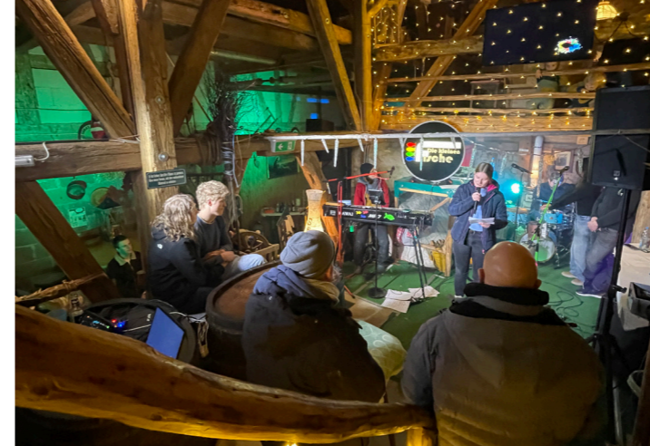
secret places im Besen in Bünzwangen