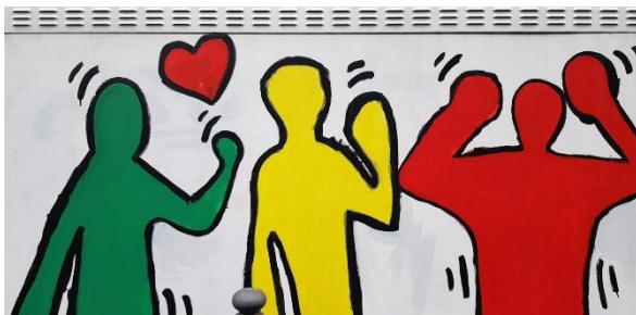
Bild: Bild: Peter Weidemann (Foto) / Dürenschule (Bild, Detail) In: Pfarrbriefservice.de