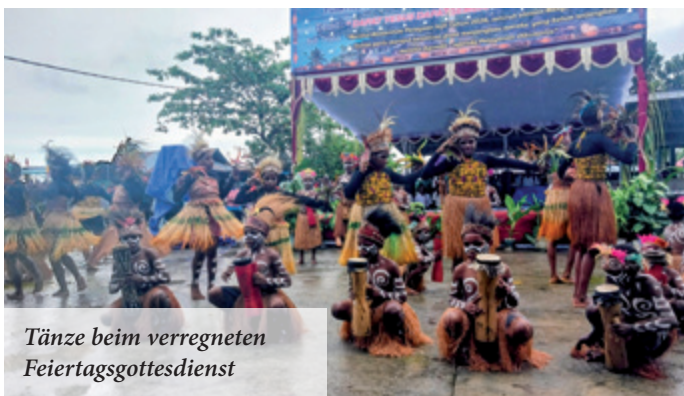
Tänze beim verregneten Feiertagsgottesdienst

die sie im Juni zur Schulausbildung nach Ost-Java bringen wird. Dort sind dann insgesamt 10 Spielerinnen im Wohnheim, die in der U-18-Mädchenliga mitspielen und eine intensive Betreuung genießen.