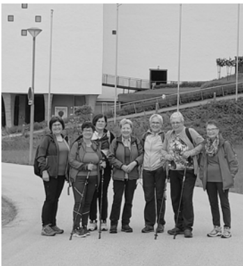
Wanderbegeisterte Damen vor dem Festspielhaus in Erl

9.5.2026 Die FFW Wilten feiert mit einem festlichen, vom Chor Shalom musikalisch gestalteten Gottesdienst ihr Florianifest .