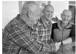
Watterabend der Männerrunde

23.1.2026 Die Männerrunde veranstaltet einen feinen Watter-Abend .