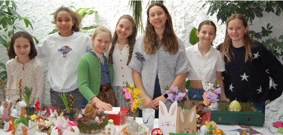
Unsere fleißigen Helferinnen beim Osterbasar