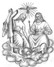
Hl. Dreifaltigkeit Ränkam