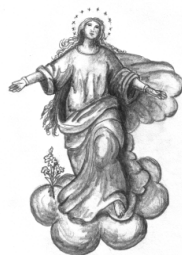
Mariä Himmelfahrt Furth im Wald