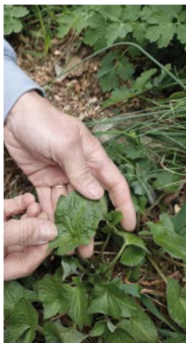
Der Gute Heinrich