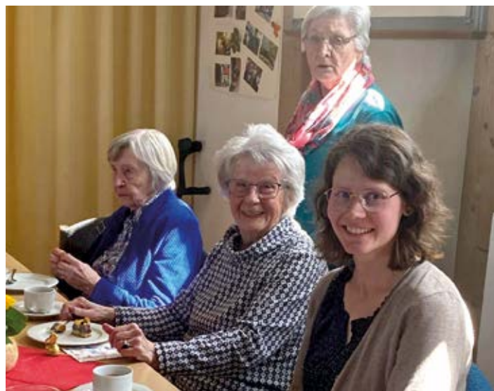
Die Vikarin besucht den Seniorenkreis