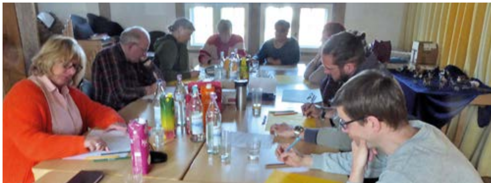
Klausurarbeit in der Roring Pfarrscheune