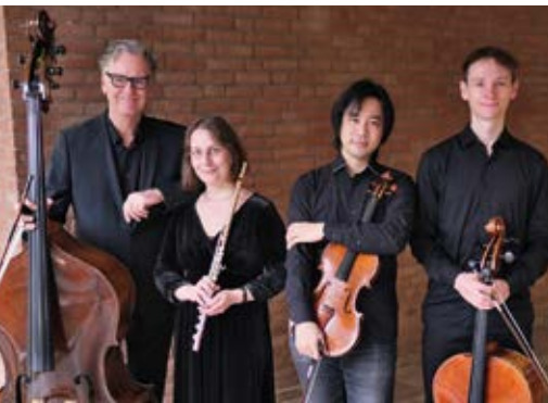
Musiker*innen des Göttinger Symphonieorchesters