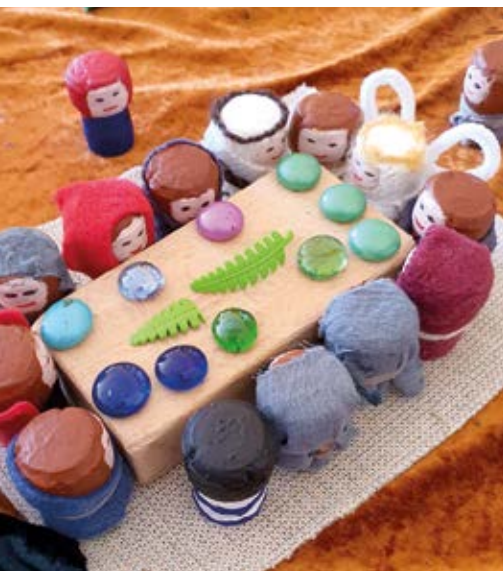
Das letzte Abendmahl