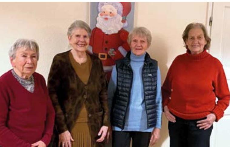
Der alte Helferinnenkreis