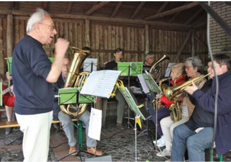
Himmelfahrts-Gottesdienst im Forstbotanischen Garten