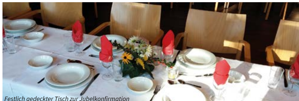
Festlich gedeckter Tisch zur Jubelkonfirmation

Am 26. Oktober 2025 feiern wir das Fest der Jubelkonfirmation.