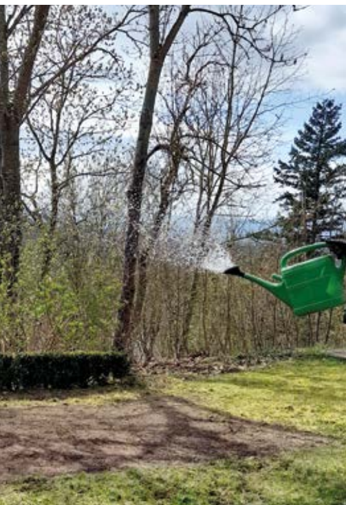
Auf der Gemeindewiese entsteht ein Blühstreifen