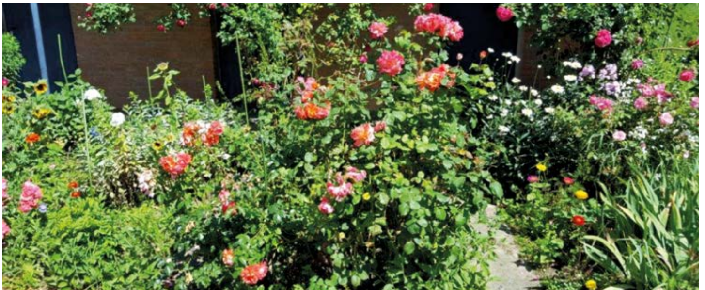
Damals in Blüte. Blumengarten Christophorus.