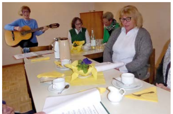
Singen beim Seniorennachmittag