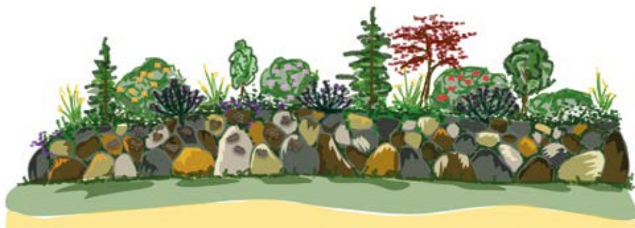
Skizze zur Friedhofsgestaltung

Der Friesenwall: Eine sanft ansteigende Begrenzung aus Findlingen, die Schutz und Beständigkeit symbolisieren. Zwischen den Steinen wird eine insektenfreundliche Bepflanzung für eine lebendige, natürliche Atmosphäre sorgen. Hier entstehen bis zu 120 Urnengräber, die in Paaren angeordnet werden. Der Felsenhain: Unter schattenspendenden Bäumen werden große und kleine Felsen als Grabmale dienen, die die Einzigartigkeit jedes Lebens widerspiegeln. Die ruhige Gestaltung dieses Bereichs lädt zur stillen Andacht ein. Insgesamt bietet der Felsenhain Platz für 80 Doppelurnengräber.