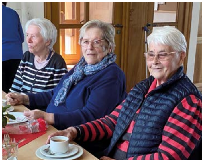
Der Seniorenkreis Roringen