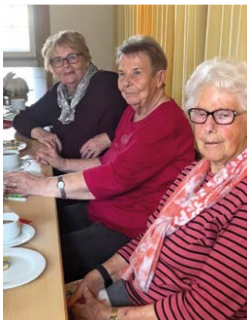
Der Seniorenkreis Roringen