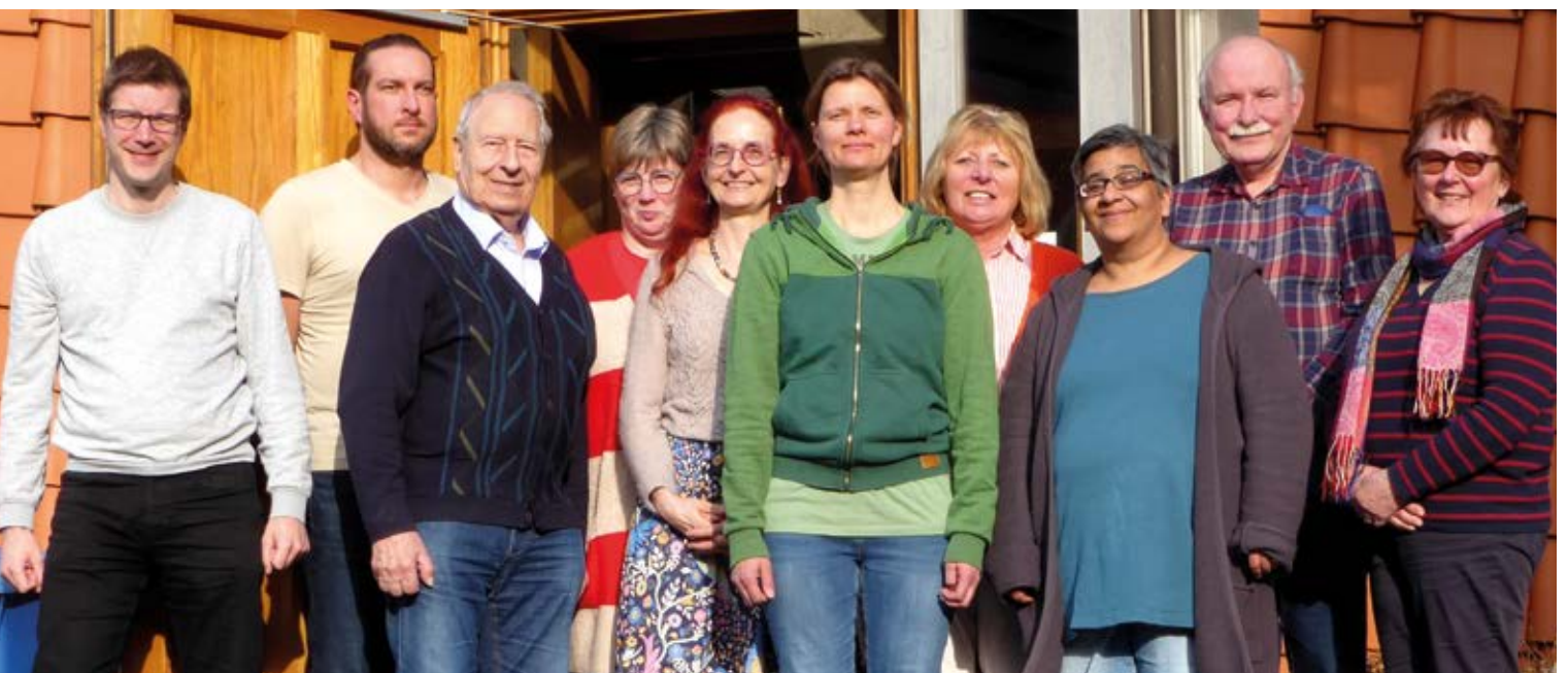
Die Kirchenvorstände Roringen und Herberhausen