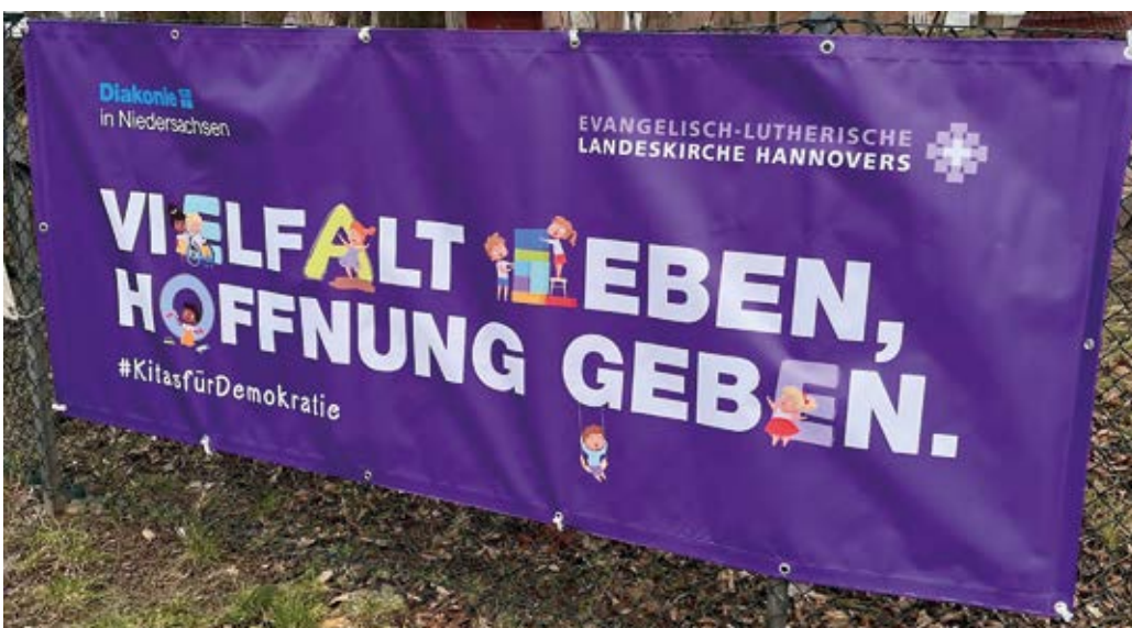
Vielfalt als Auftrag

Die »KI« sagt: »Inklusion bezeichnet den Ansatz, Menschen mit unterschiedlichen Fähigkeiten, Hintergründen und Bedürfnissen in alle Bereiche des gesellschaftlichen Lebens einzubeziehen. [...] Ziel der Inklusion ist es, Chancengleichheit zu schaffen und Diskriminierung zu vermeiden, sodass jeder Mensch die Möglichkeit hat, aktiv am gesellschaftlichen Leben teilzunehmen und seine Potenziale zu entfalten. Inklusion fördert ein respektvolles Miteinander und die Wertschätzung von Vielfalt.« (ChatGPT-4o mini)