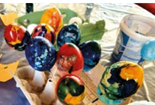
Eier werden gefärbt