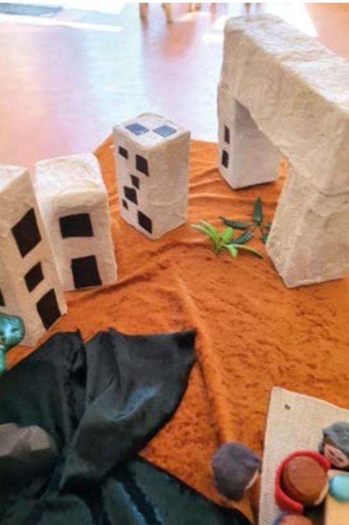
Der Einzug in Jerusalem wird vorbereitet