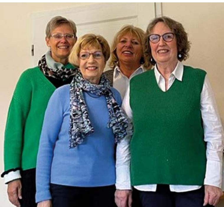
Der neue Helferinnenkreis