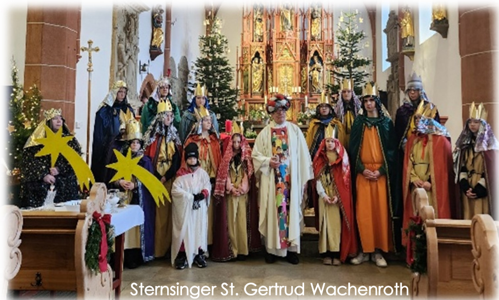
Sternsinger St. Gertrud Wachenroth

Um 17.00 Uhr feiern wir im Pfarrheim einen Gottesdienst mit der Möglichkeit zur Krankensalbung. Herzliche Einladung