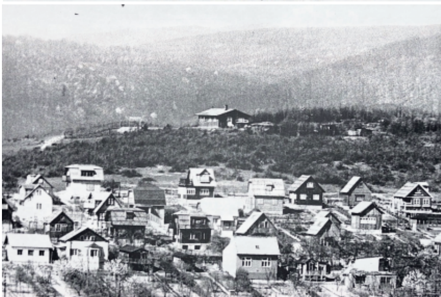
Blick auf die Sommerschule, 1934

Wolfersbergs zurück (wie Sonnenweg, Mondweg, Merkurweg usw.). Prof. Koch hielt auch Vorträge zu damals aktuellen Technologien wie etwa über drahtlose Telegrafie und Telefonie. Das Spektrum der Themen der angebotenen Kurse und Vorträge war außerordentlich groß: es reichte von naturkundlichen Vorträgen wie Wetterkunde, heimische Flora und Fauna, Gartenfragen, über Sprachkurse (etwa Englisch oder Französisch), Handarbeits- oder Zeichenkurse bis hin zu Vorträgen über Literatur. Aber auch Hilfe und praktische Tipps bei Siedlerproblemen wurden angeboten. Großen Anklang fanden die seit dem Jahr