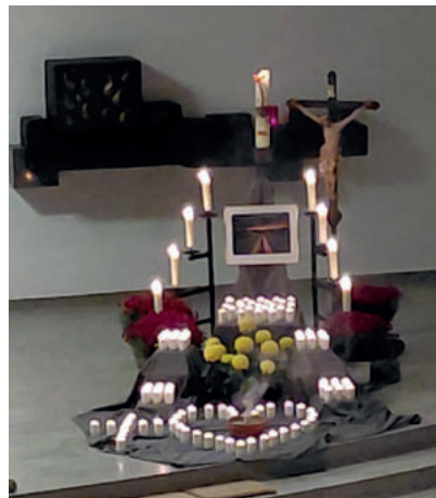
Kirche St. Josef, MAR Allerseelen 2025