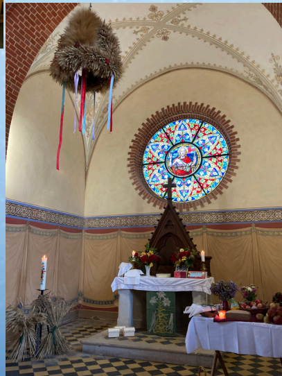
Fotos Pilgern bei Sassen, Erntedank in Gülzowshof, Erntefest Sassen: L. Espelöer