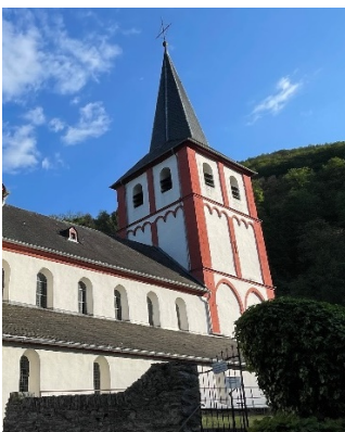
St. Bartholomäus, Hirzenach