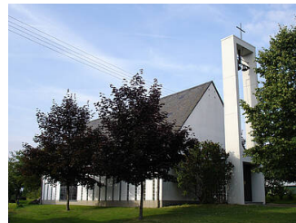
Kapelle in Oppenheim