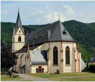
St. Ägidius, Bad Salzig