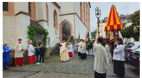
Fronleichnamsprozession in Boppard