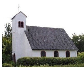
Kapelle in Hübingen