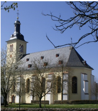
St. Pankratius, Herschwiessen

Samstag, Sonntag und Feiertage, 10:00-18:00 Uhr