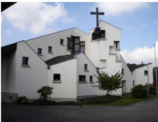
St. Sebastian, Buchholz