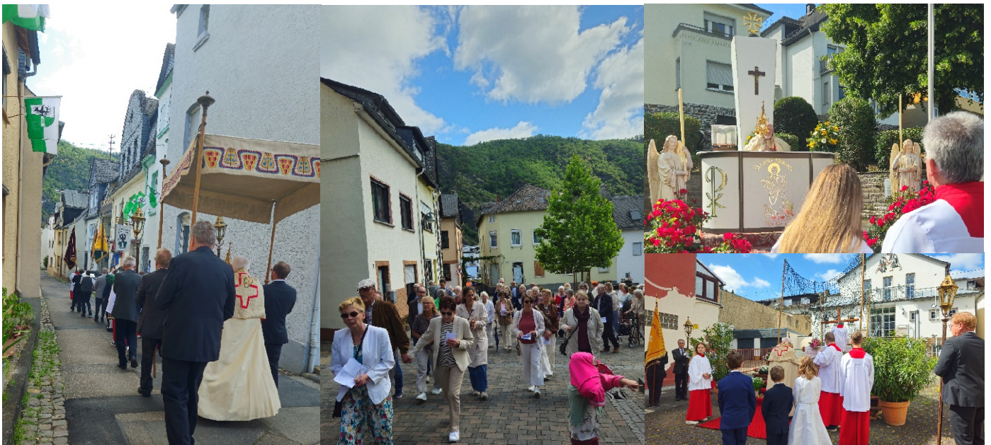
Fronleichnamsprozession in Bad Salzig