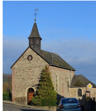
St. Sebastian, Rheinbay