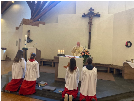
Fronleichnamsmesse in Buchholz

Ein herzliches Dankeschön geht an alle, die zum Gelingen des Festes an den verschiedenen Orten beigetragen haben. Dazu gehören die MessdienerInnen, die LektorInnen und KommunionhelferInnen, SängerInnen des Chores und all jene Gemeindemitglieder, die den Himmel oder die Fahnen getragen haben. Außerdem geht ein herzliches Dankeschön an alle ehrenamtlichen HelferInnen die am Aufbau und Schmuck der Altäre mitgewirkt haben und an die Freiwillige Feuerwehr Bad Salzig für den Schutz des Prozessionswegs.