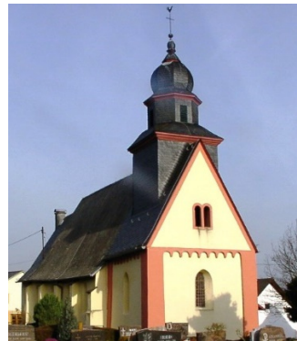
St. Peter in Ketten, Weiler

Samstag, Sonntag und Feiertage, 10:00-18:00 Uhr