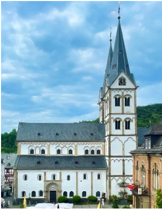
Basilika und Karmeliterkirche, Boppard