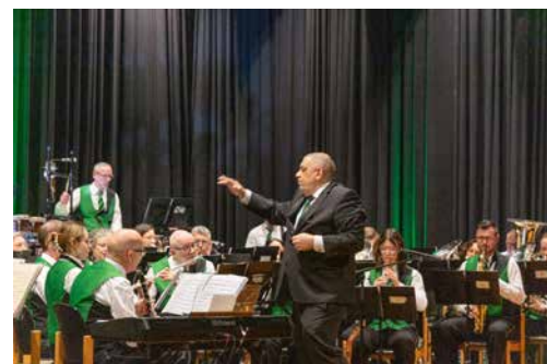
Die Harmoniemusik Buchs swingt und stimmt ins Fest ein.

Die Sommerferien stehen vor der Tür und locken zu manchem Abenteuer: Kinder, Jugendliche und Erwachsene freuen sich auf eine Abkühlung im Wasser der Badi, der Seen und im Meer, geniessen Wanderungen in den Bergen, erkunden fremde Länder und andere Kulturen. Und immer in der Hoffnung, dass wir uns alle gesund und gestärkt wiedertreffen.