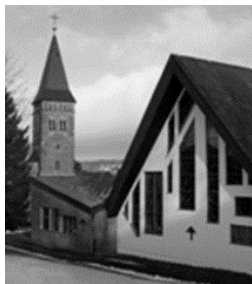
St. Martinus Wilnsdorf St.-Martin-Str. 1 57234 Wilnsdorf