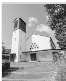
St. Josef Wilgersdorf St.-Josef-Weg 2a 57234 Wilnsdorf