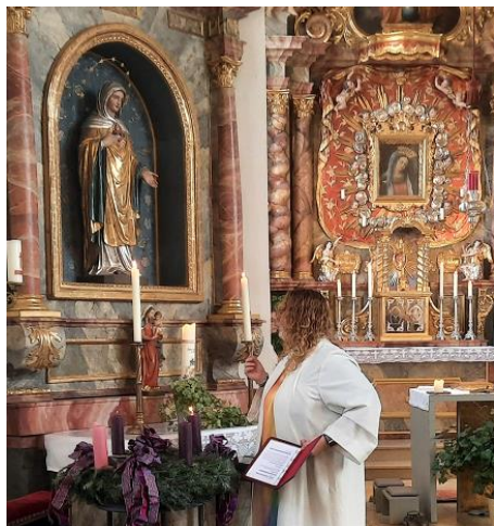
Adventskranzsegnung und Aussendung der Mutter Gottes zum Frauentragen.