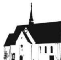
ST. PETER MERNES

Das Pfarrbüro in Oberndorf ist am Do., 19.02.2026 wegen einer Fortbildung geschlossen.