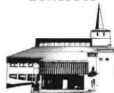
HERZ JESU PFAFFENHAUSEN

Pfarrbote auch online: www.katholische-kirche-jossgrund.de oder QR-Code scannen