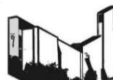
KOSTBARES BLUT BURGJOSS