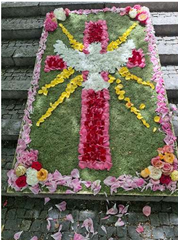
Blumenteppeich vor St. Laurentius