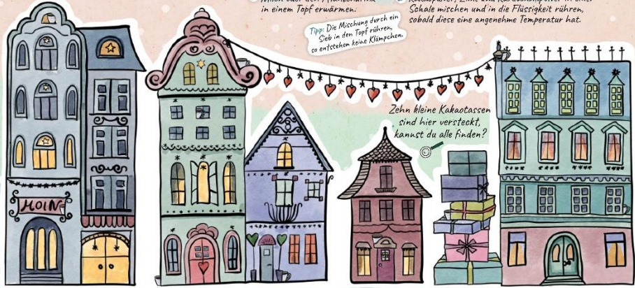
Illustration: Wilfried, Illustration: Marianne, Synthesize, © www.illustration.com

Zehn kleine Kakaoasson sind hier versteckt, kannst du alle finden?