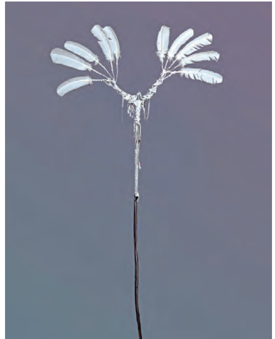
Großer Engel Ulrich Schwecke, 2024