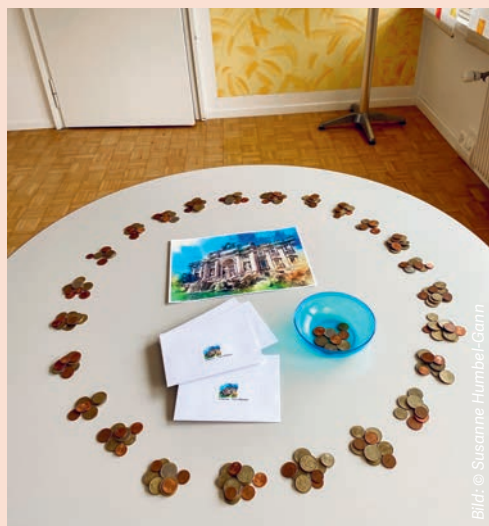
25 Münzhäufchen werden in Kuverts verteilt.

Bevor es so weit ist, habe ich in meiner Funktion als Sekretärin und Buchhaltungsbeauftragte des Pfarramtes eine kleine Münzaktion gestartet und das Geld in Kuverts verteilt. Eines für jede Person, die mit nach Rom reist. Schliesslich liegen 25 Kuverts auf dem runden Tisch in meinem Büro bereit.