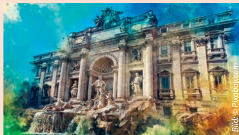
Fontana di Trevi

ziell beauftragten Mitarbeiter*innen der Stadt eingesammelt und gereinigt. Gemäss Medienberichten sind das jährlich schätzungsweise rund 1,5 Millionen Euro. Das Geld kommt der Caritas di Roma zugute. Das Hilfswerk finanziert damit Projekte zur Unterstützung der Bedürftigsten, wie zum Beispiel Essensausgaben.