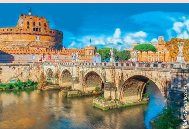
Engelsburg in Rom.

SEELSORGEEINHEIT ALTE KONSTANZER-STRASSE Zum Abschluss des Firmwegs verbringt die Firmgruppe vom 11. bis 15. April einige Tage in Rom. Auf dem Programm stehen unter anderem der Petersdom, ein Besuch bei der Päpstlichen Schweizergarde, die Besichtigung der Engelsburg sowie ein Ausflug zur Via Appia Antica. Natürlich dürfen auch Pizza, Pasta und ein gutes Glas Vino nicht fehlen.