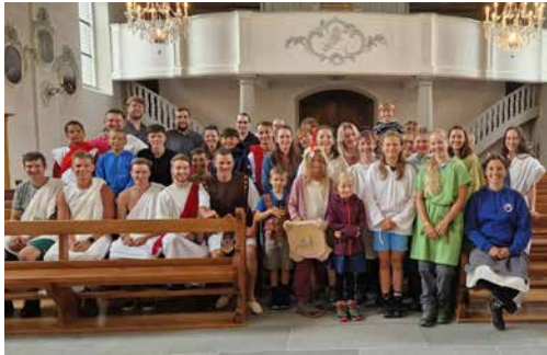
Die fröhliche Jubla-Schar beim Lagersegnen 2025.

... Abenteuer, Gemeinschaft und unvergessliche Erlebnisse