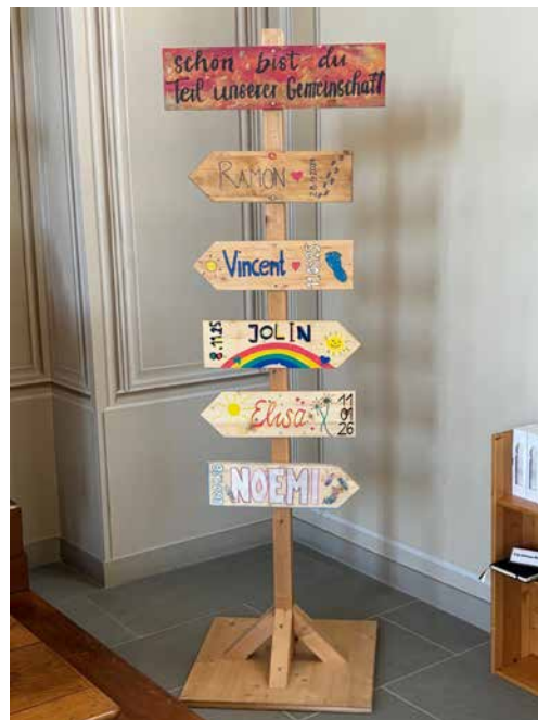
Taufwegweiser Pfarrkirche Bünzen

Es werden in diesem Gottesdienst auch die Taufwegweiser der Taufkinder bis 2025 an die Familien zurückgegeben.