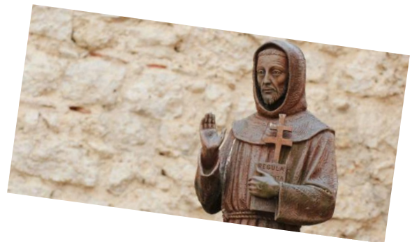
Franziskusskulptur im Klosterhof des Klosters in Fonte Colombo, Italien

Schließlich wurde ihm deutlich, dass der Auftrag, den er vor dem Kreuz in San Damiano gehört hatte, im übertragenen Sinne zu verstehen ist. In der Porziunculakapelle hörte er das Evangelium von der Aussendung der Zwölf (vgl. Mt 10,1-15). Die Aufforderung Jesu an die Jünger bezog er auf sich: Er legte den Wanderstab beiseite, zog seine Sandalen aus, tauschte den Ledergürtel (in dem damals üblicherweise das Geld aufbewahrt wurde) gegen einen Strick und durchstriefte von nun an predigend das Land. Seine Lebensweise war so überzeugend und beispielhaft, dass sich ihm schon bald Gefährten anschlossen, mit denen er im Jahre 1209 nach Rom reiste, um sich seine Lebensform von Papst Innozenz III. bestätigen zu lassen. Zunächst erfolgte eine mündliche Bestätigung. Die schriftliche Besiegelung lieferte erst die endgültige Ordensregel, die Franziskus 1223 verfasste und die von Honorius III. die päpstliche Anerkennung erhielt; sie besitzt bis auf den heutigen Tag Gültigkeit.