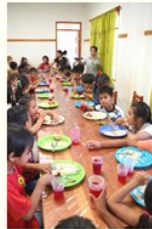
Voorbeeld: Velatacú, Riberalta

Dit jaar wil Vastenactie het werk van het bisdom Pando in de gevangnissen steunen en de inrichting van een naschoolse opvang financieren zodat kinderen een veilige plek hebben waar ze na school terecht kunnen. U kunt deelnemen aan de jaarlijkse Vastenactie via de collecte in de kerk of rechtstreeks op www.vastenactie.nl , daar leest u ook meer over het werk in Pando.